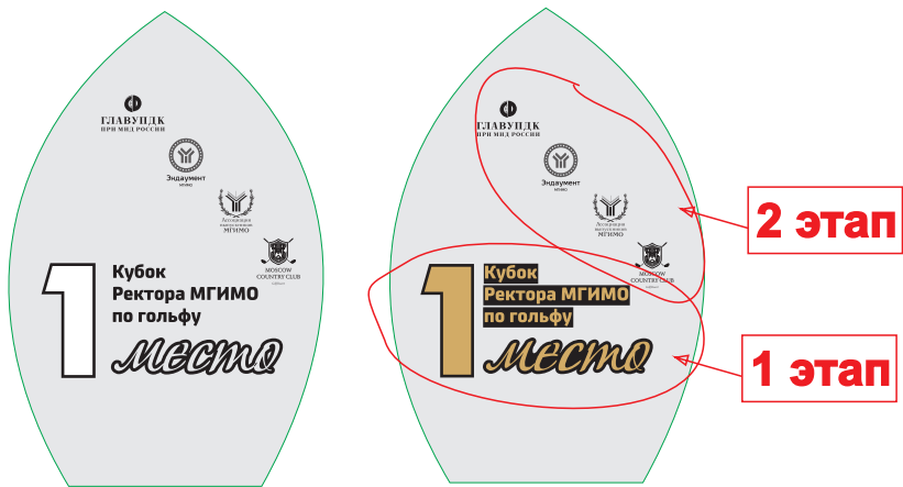
Гравировка Гравировка с фольгой +Гравировка

ТРЕБОВАНИЯ К МАКЕТАМ Минимальная толщина линии 0,2мм Минимальный размер шрифта 6п. Обязательно все шрифты должны быть переведены в кривые. Все объекты должны: быть покрашены 100% черным цветом, быть в векторе (логотипы, надписи, подписи, знаки). Полутонные изображения не гравим. Гравировка с фольгой делается только спереди награды.